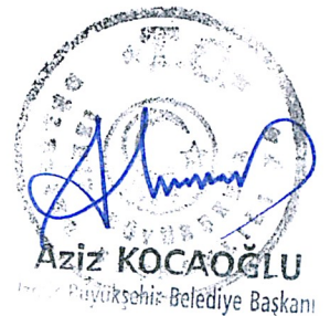
Aziz KOCAOĞLU Büyükşehir Belediye Başkanı