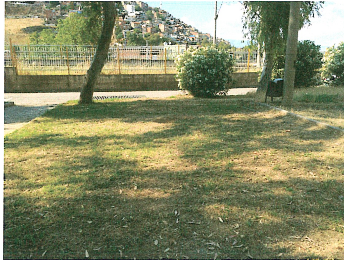
Çalışma Alanına Ait Fotoğraflar