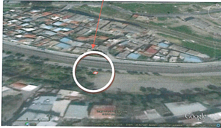
Çalışma Alanının Uydu Görüntüsü Üzerindeki Konumu