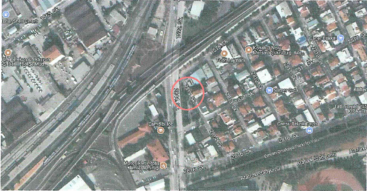
Şekil 1: İmar Planı Değişikliği Alanının Uydu Görüntüsü

İmar Planı Değişikliğinin amacı, çevresindeki yerleşim birimlerinin enerji altyapısındaki eksikliğin giderilmesi için güncel imar planları üzerine trafo gösteriminin yapılmasıdır.