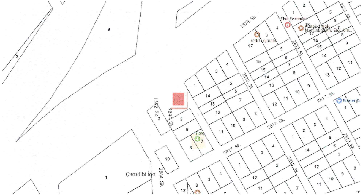
Şekil 3: Mülkiyet Durumu

Tüm yerleşmelerde olduğu gibi, gelişen teknoloji ve gereksinimler doğrultusunda ana enerji dağıtımını yetersiz kalmaktadır. Enerji dağılımının sağlıklı yapılabilmesi ve AG-YG Elektrik Tesisini sağlamak amacı ile rapor ekinde yer alan plan değişikliği paftası sunulmuştur.