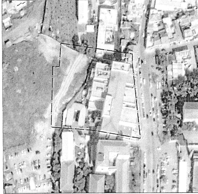
Resim 1: Planlama Alanının Uydu Görüntüsü

Planlama alanının içerisinde yer aldığı Tepecik Mahallesi, İzmir İlinin merkezinde yer alan Konak İlçesinde yer almaktadır.