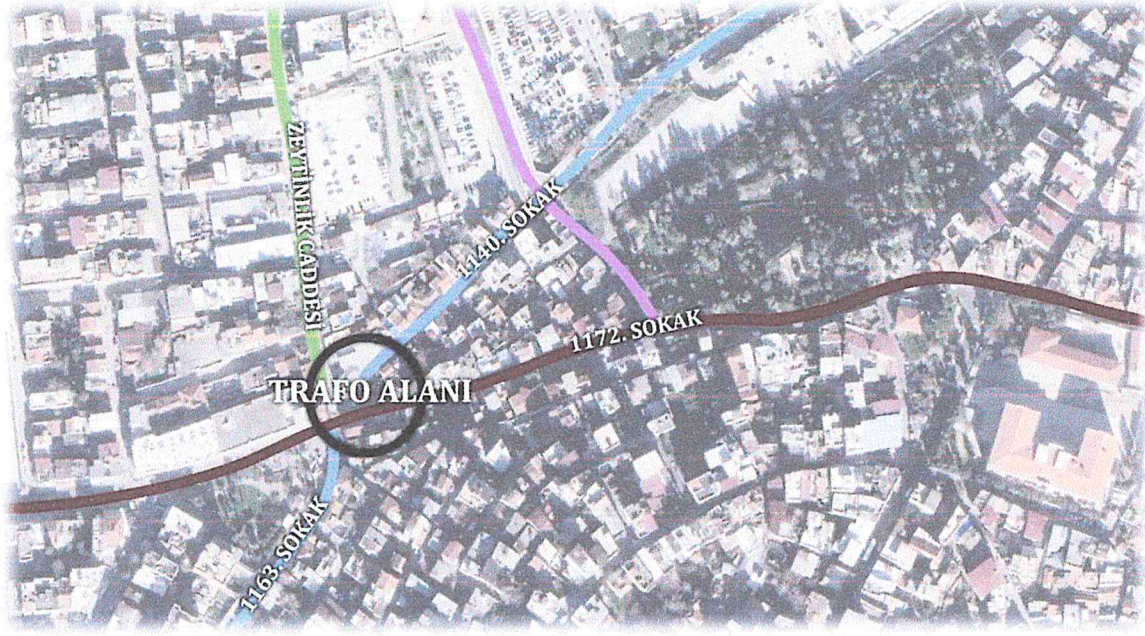
Harita 2: Trafo Alanı Konumu ve Ulaşım Durumu

Trafo alanı olarak belirlenen alan kuzeyindeki Zeytinlik Caddesinden, kuzey doğusundaki 1140. Sokak'tan, güneyindeki 1163. Sokak'tan ve doğusundaki 1172. Sokak'tan servis almaktadır.