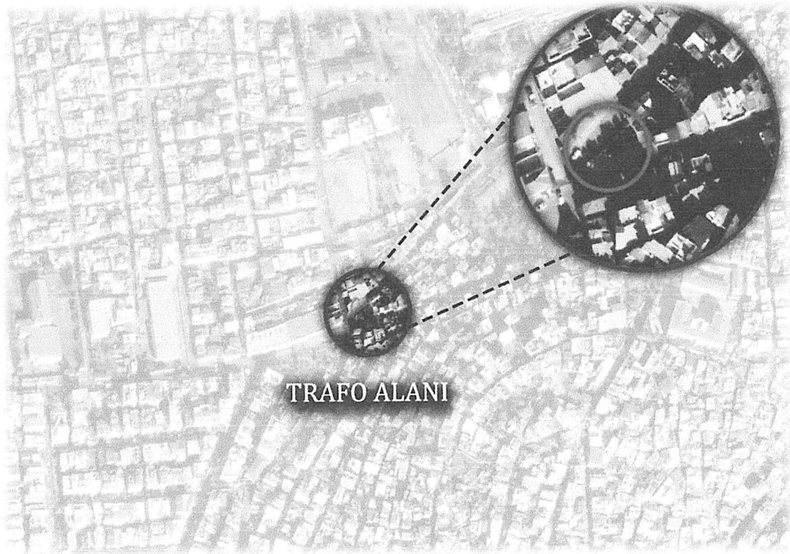
Harita 1: Trafik Alanı Uydu Görüntüsü

Planlama alanının yer aldığı Konak, Türkiye'nin İzmir ilinin bir ilçesidir. İlçenin yüzölçümü 24 km 2 'dir. Kuzeyinde İzmir Körfezi, kuzeydoğusunda Bayraklı, doğusunda Bornova, güneyinde Buca ve Karabağlar, batısında Balçova ilçeleri bulunmaktadır. Konak ilçesinde 2008 yılı itibarıyla 113 mahalle bulunmaktadır. Planlanan trafik alanı Güney mahallesinde yer almaktadır. İlçenin toplam sokak adedi 2.905, cadde adedi 90, bulvar adedi 19, meydan adedi 14'tür.