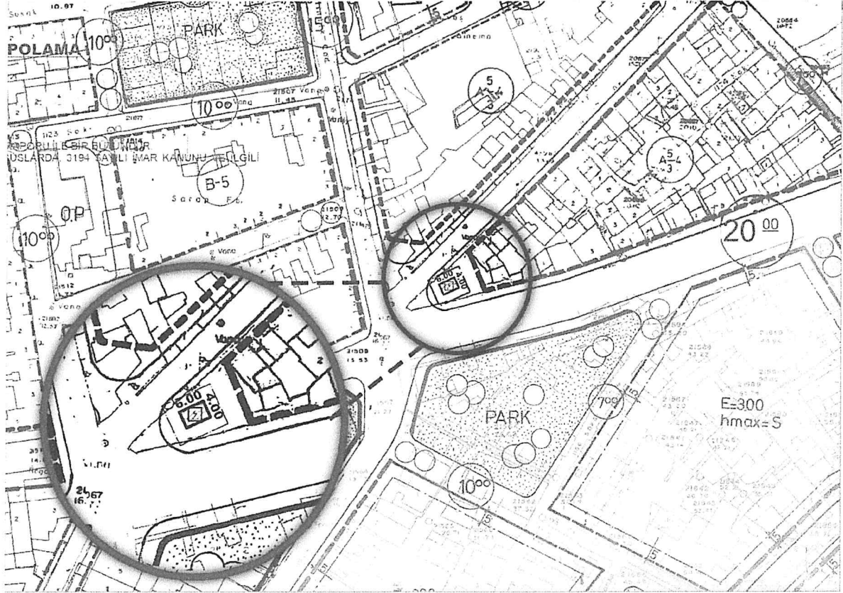
Harita 5: Trafo Alanı Öneri Uygulama İmar Planı

Planlanan trafo alanı 6X4 m ölçülerinde olmak üzere toplamda 24 m 2 'lik alana sahiptir.