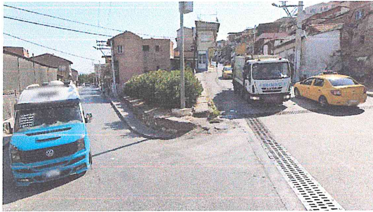
Görsel 1: Trafo Alanı