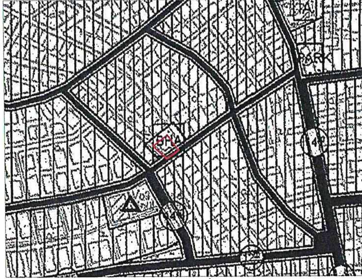
Resim 2: 1/5000 ölçekli Nazım İmar Planındaki konumu