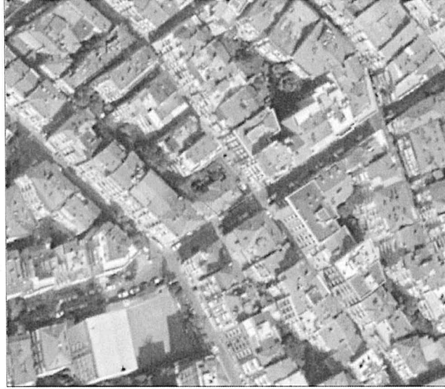
Resim 1: Planlama Alanının Uydu Görüntüsü

Planlama alanının içerisinde yer aldığı Köprü Mahallesi, İzmir İlinin merkezinde yer alan Konak İlçesinin kuzeyinde yer almaktadır.