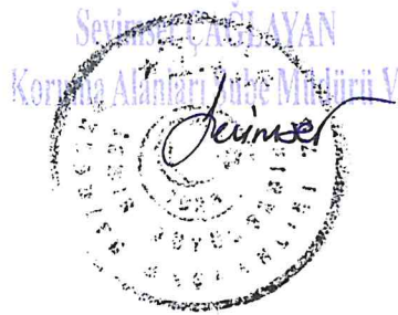
Mustafa Tunç SOYER Meclis Başkanı